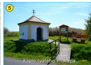
Kaple svatého Prokopa