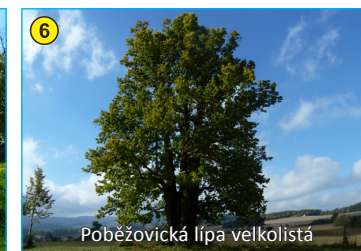
Poběžovická lípa velkolistá