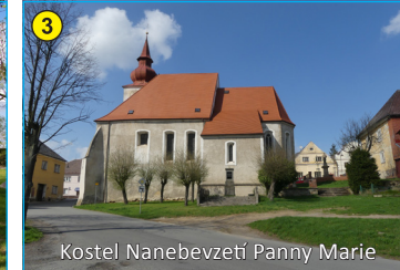
Kostel Nanebevzetí Panny Marie