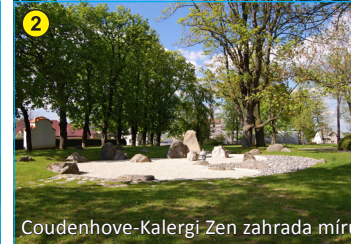
Coudenhove-Kalergi Zen zahrada míru