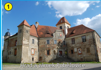
Hrad a zámek Poběžovice